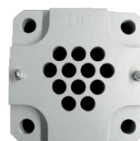
Numar articol 4044253