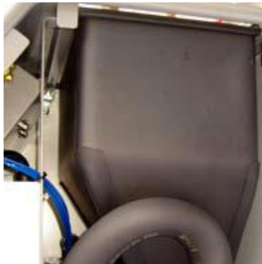
CUVA IZOLANTA PT 24 KG GHEATA CARBONICA