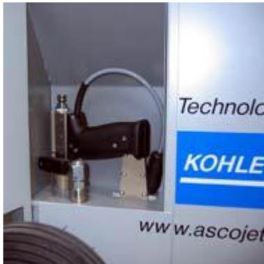
LOCAS PT PISTOL, DUZA SCULE